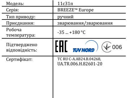
Таблиця 1. Характеристики